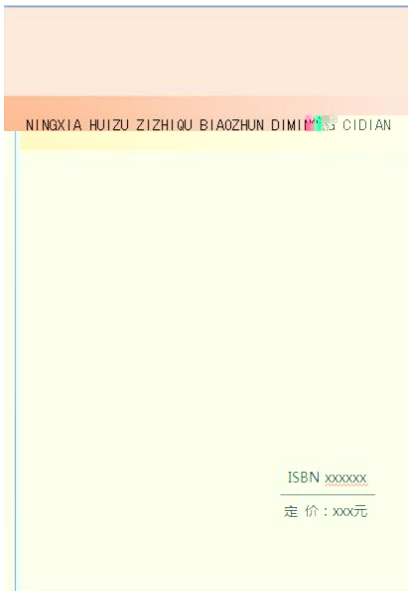
图 A. 2 标准地名词典封面样例